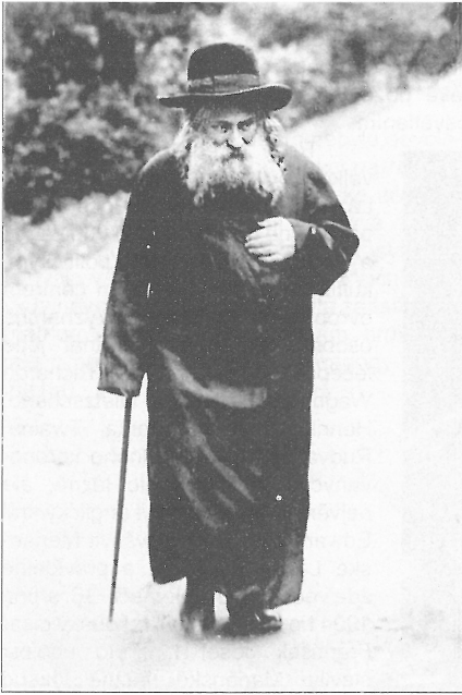
Rabín na procházce po Mariánských Lázních

hospicu. Během letních měsíců bydlel v Mariánských Lázních a v zimě přednášel na univerzitách v Praze, Vídni, Berlíně a Vratislavi. Velmi se zasloužil o rozvoj města, napsal více než 200 knih o Mariánských Lázních a jejich pramenech (a také průlomovou práci o cizoložství). Zejména je vzpomínám v souvislosti se založením Výzkumného ústavu balneologického. Po jeho smrti po něm byla pojmenována jedna ulice v Mariánských Lázních (dnešní Fibichova). Je pohřben na židovském hřbitově za městem. Hospic sloužil až do roku 1930 (dnešní dům Sion, Lesní ulice č. 102/6).