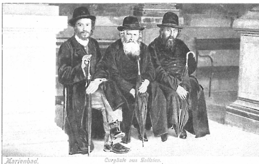
Židé v Mariánských Lázních na pohlednici

V roce 1868 mělo město 1591 obyvatel a zaznamenalo 5554 návštěvníků. V roce 1872 byly Mariánské Lázně napojeny na rozrůstající