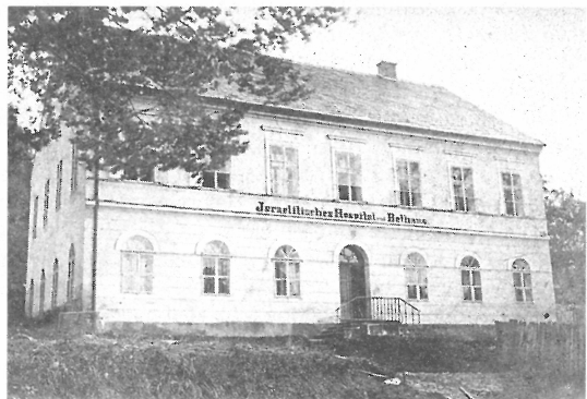
První židovská modlitebna a hospic v Mariánských Lázních